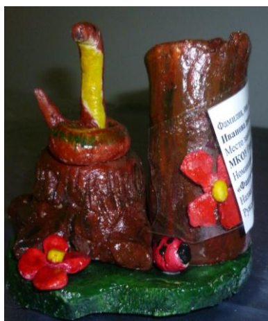
«Змейка» МКОУ Генераловская СОШ