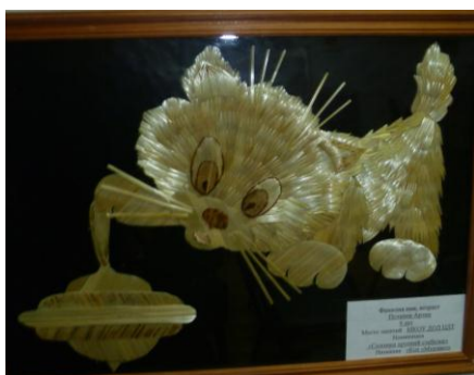
Кот «Мурзик» из соломки МКОУ ДОД ЦДТ

Словно живой на нас смотрит котенок из «соломки», бежит к нам на встречу «Мальчик с пальчик» из «соленого теста», поражает воображение «Кленовый лист» из «дерева». Здесь можно увидеть работы учащихся и воспитанников МКОУ ДОД ДЭЦ, МКОУ ДОД ЦДТ, МКОУ СОШ № 2, МКОУ СОШ № 3, МКОУ СОШ № 4, МКОУ СОШ № 5, МКОУ Генераловской СОШ, МКОУ Ленинской СОШ, МКОУ Нагавской ООШ, МКОУ Нагольненской СОШ, МКОУ Нижнеяблоченской СОШ, МКОУ Пугачевской СОШ, МКОУ Чилековской СОШ.