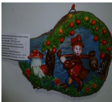
«Мальчик с пальчик» МКОУ ДОД ДЭЦ