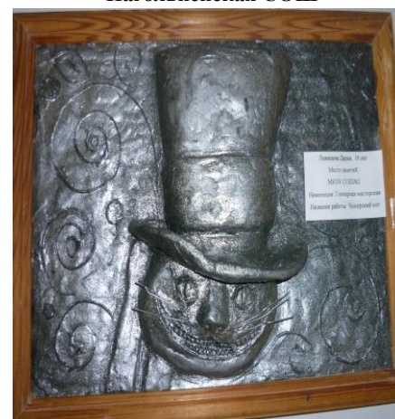
«Чеширский кот» МКОУ СОШ № 2