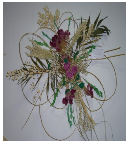
«Настроение» МКОУ Пугачевская СОШ

Работы победителей и призеров районного конкурса творческих работ «Зеркало природы» примут участие в областном конкурсе творческих работ «Зеркало природы», который состоится в феврале-марте 2013 г.