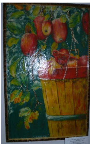
«Яблочный рай» МКОУ Нагольненская СОШ