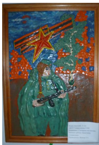
«Защитница Сталинграда» МКОУ Генераловская СОШ