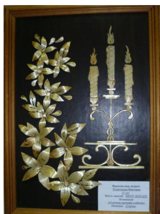
«Свеча» МКОУ ДОД ЦДТ